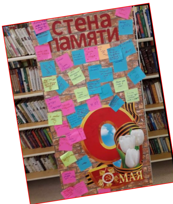
Экскурсия в библиотеку

Во время экскурсии в музей ребята узнали много нового и интересного о событиях ВОВ, о подвигах русских солдат, о мужестве наших земляков. Они с большим интересом слушали экскурсовода, рассматривали экспонаты.